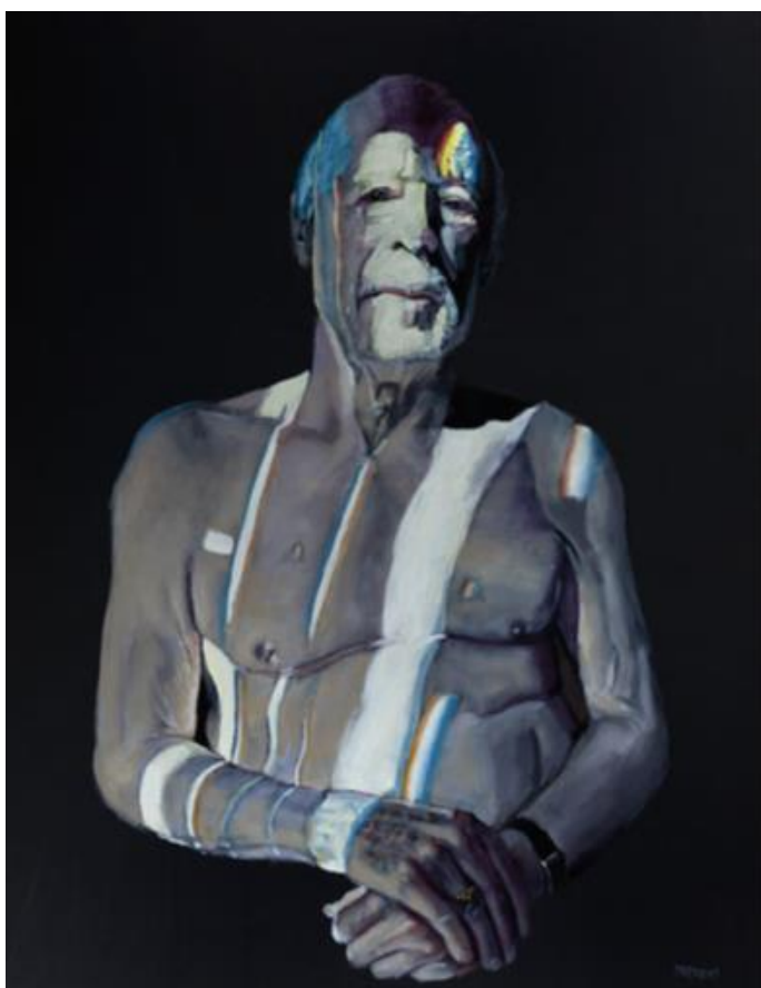
Leszek Sobocki, Znamię , 2021, olej / płótno, 90 × 70 cm