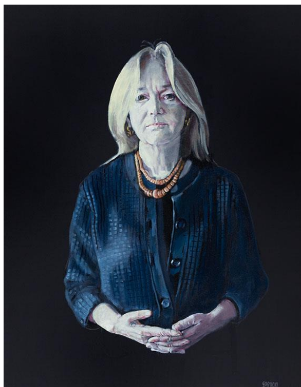
Leszek Sobocki, Anna Król , 2021, olej / płótno, 90 × 70 cm, courtesy L. Sobocki, fot. R. Sosin