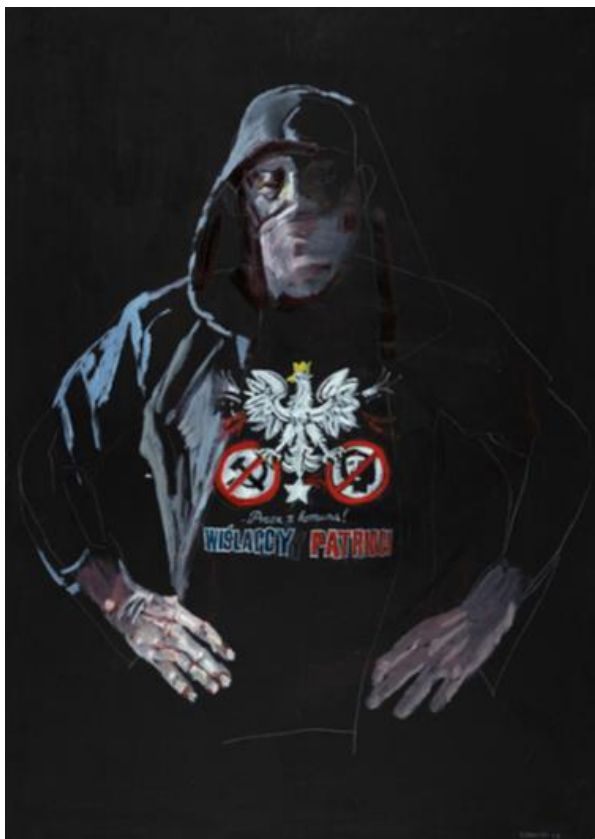
Leszek Sobocki, Kibol I , z cyklu Kibole , 2013, olej, akryl / karton, 100 × 70 cm, courtesy L. Sobocki, fot. R. Sosin