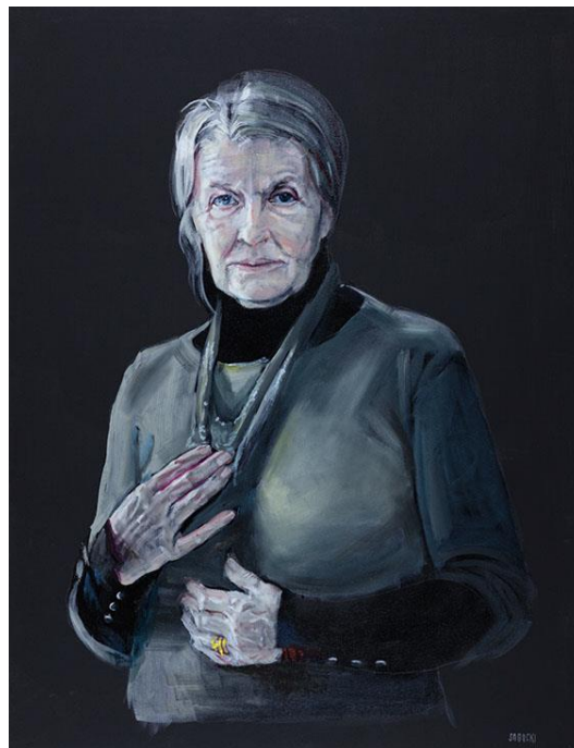
Leszek Sobocki, Teresa Kastelik , 2017, olej / płótno, 90 × 70 cm, courtesy L. Sobocki, fot. R. Sosin