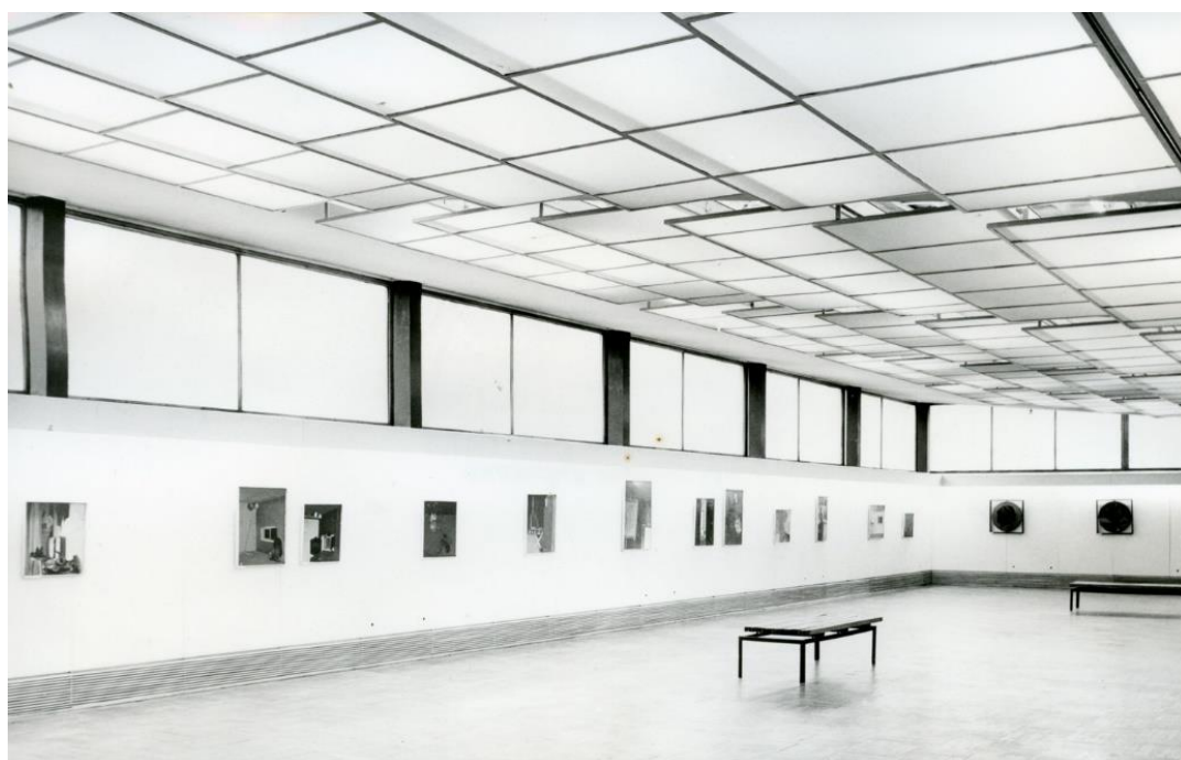
Dokumentacja otwarcia wystawy Jerzy Nowosielski w krakowskim BWA, 1974, (dziś: Galeria Sztuki Współczesnej Bunkier Sztuki)