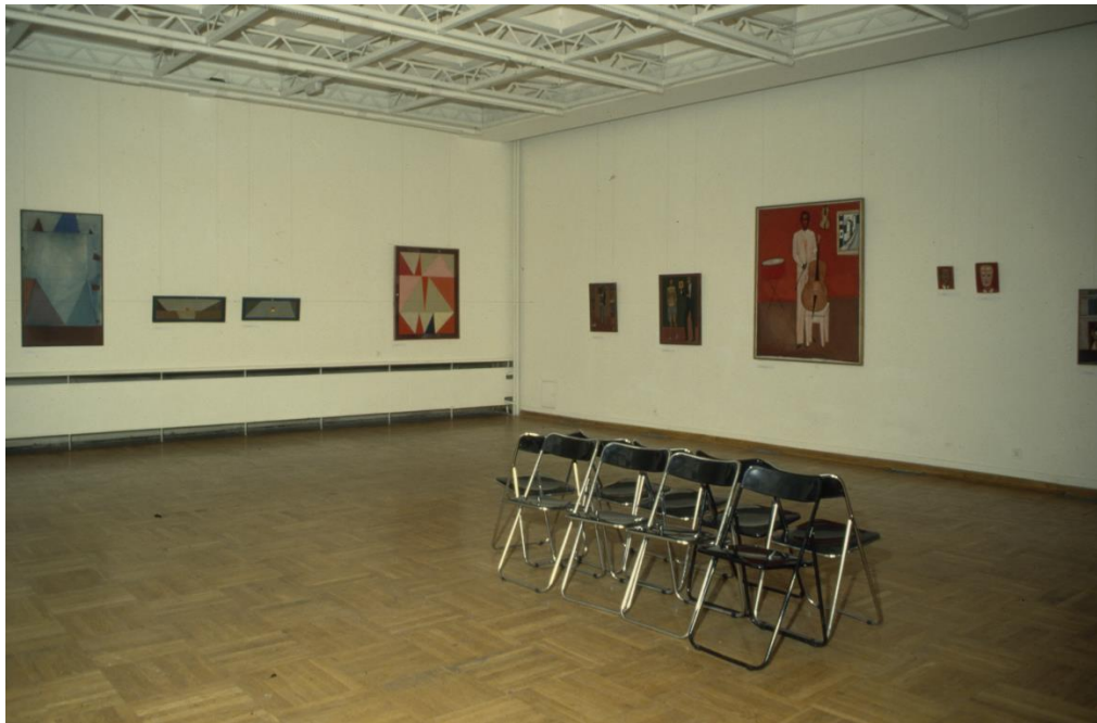
Dokumentacja otwarcia wystawy Jerzy Nowosielski. Malarstwo w Galerii Bunkier Sztuki, 1994, kurator: Włodzimierz Nowaczyk