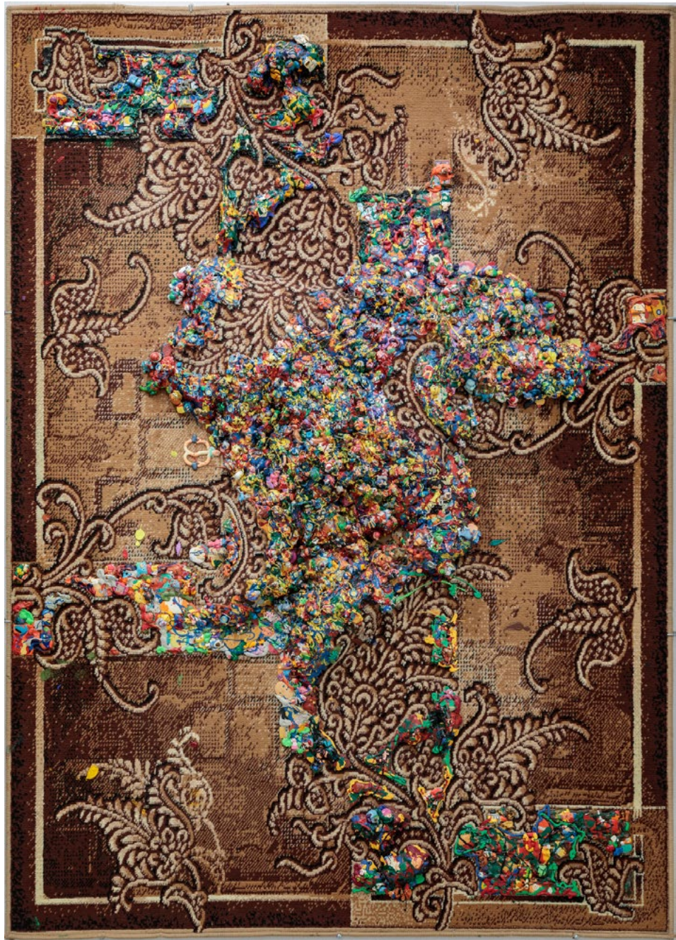
Marta Antoniak, Dywan II , 2016 technika własna na płycie pilśniowej, 200 × 140 cm