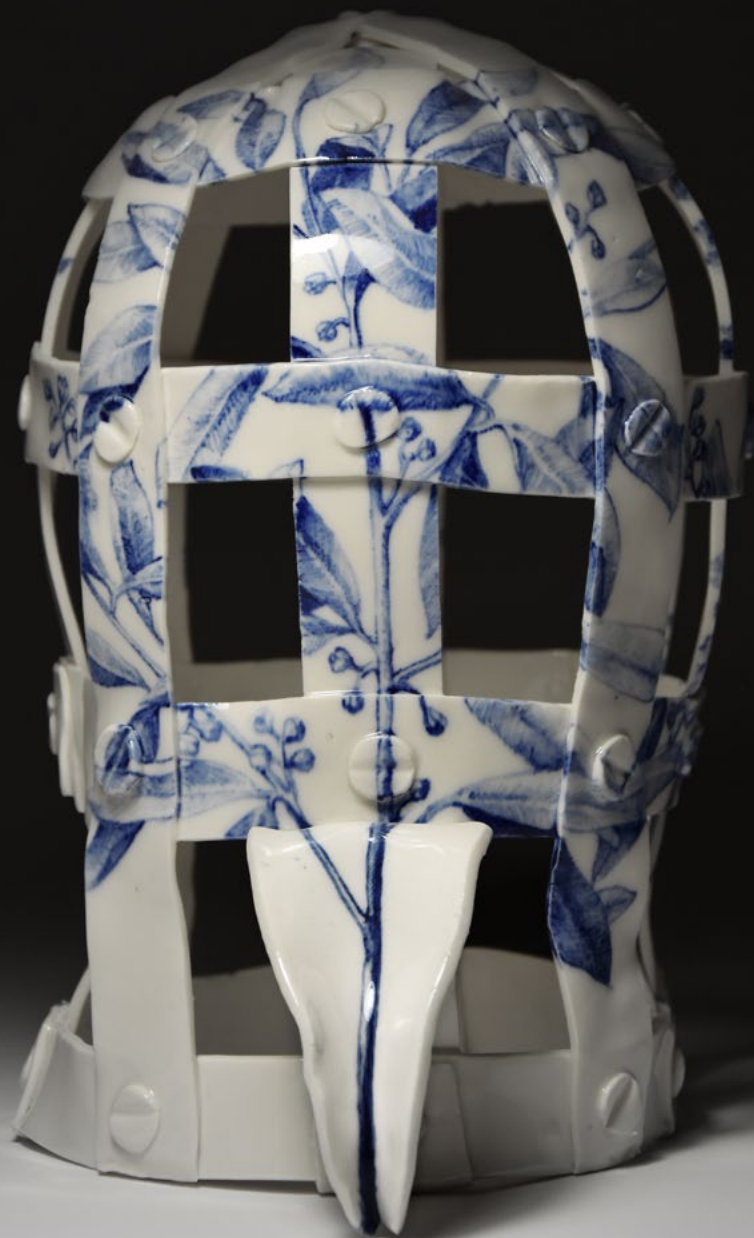
Wojciech I. Sobczyk, Maska wstydu z serii O próżnej sławie i ulotnym smaku truskawki lub poziomki , 2020 porcelana, tlenek kobaltu, szklivo bezbarwne błyszczące, 25,5 × 17 × 21 cm