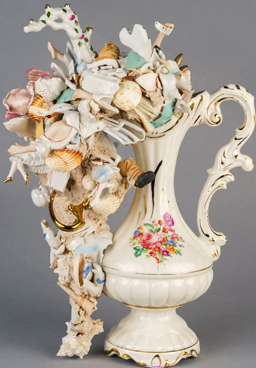
Justyna Smoleń, Fall in Love , 2022

porcelana, muszle, ceramika, zaprawa klejowa, 43 × 30 × 25 cm